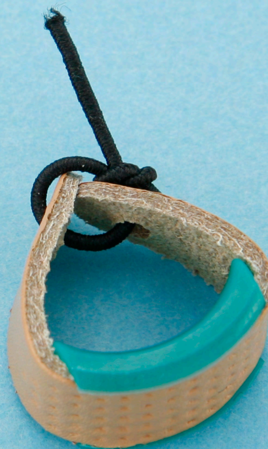
みじかばり 短針用